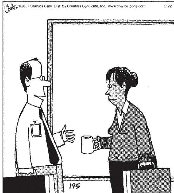
"KUN TAJUSIN OLEVANI PATOLOGINEN VALEHTELIJA, NIIN TIESIN MINULLA OLEVAN VALOISA TULEVAISUUS MYYNTIHOMMISSA."