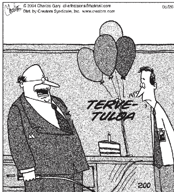
"OKEI, NELJÄN VIIKON KUHERRUSKUUKAUSI ON OHI ! ON AIKA, ETTÄ ALAN KOHDELLA SINUA KUIN TAVALLISTA TYÖNTEKIJÄÄ."